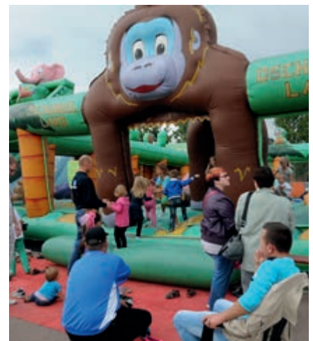
Die größte Hüpfburg Europas war das Highlight für die Kinder.