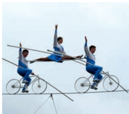
Starker Auftritt der Geschwister Weisheit.