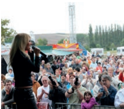
Stargast Rosanna Rocci sorgte für den ersten großen Höhepunkt des Jubiläums.